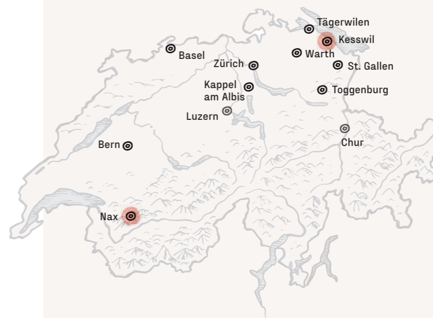
Kesswil: Ceres Schweiz, Hauptstandort Nax: Ceres Schweiz, zweiter Produktionsstandort