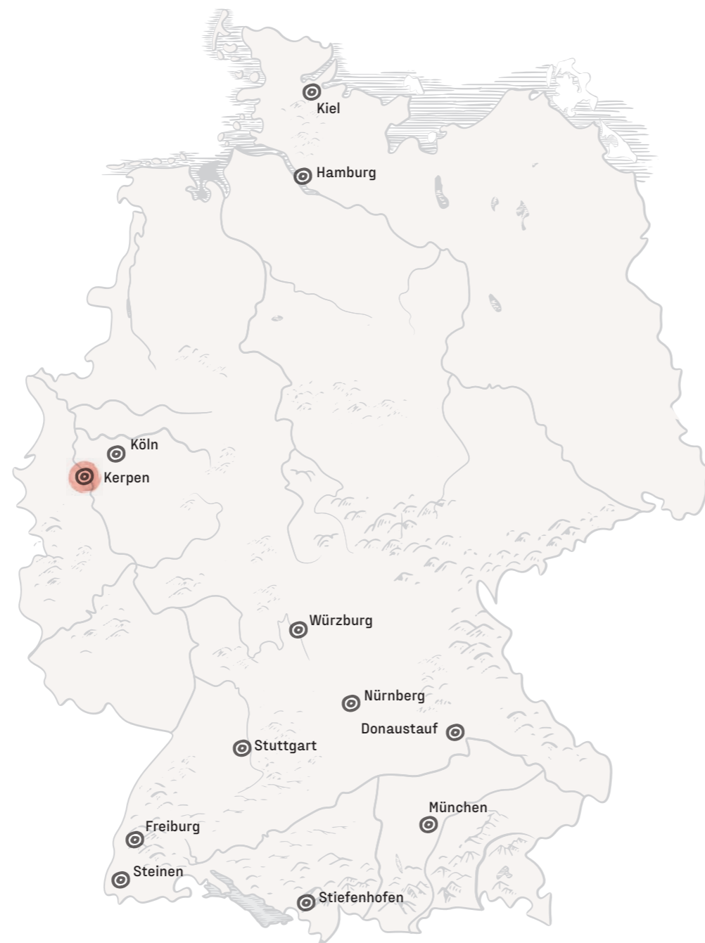
Kerpen: Ceres Deutschland